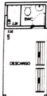
Banheiro e Área de Descanso Esc. 1:100

A pista foi sugerida para ser implantada na Área Verde 2 de 7.490,70 m 2 existente no Residencial Parque Primavera. A largura da pista é de 1,20m com declividade lateral de 1% para evitar acúmulo de águas e será de terra batida e apiloada.