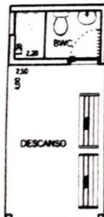
Banheiro e Área de Descanso Esc. 1:100

A pista foi sugerida para ser implantada na Área Verde 2 de 7.490,70 m 2 existente no Residencial Parque Primavera. A largura da pista é de 1,20m com declividade lateral de 1% para evitar acúmulo de águas e será de terra batida e apiloada.